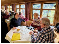
Vorstandstisch in der "Stiva"