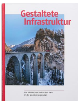
von Karl Baumann