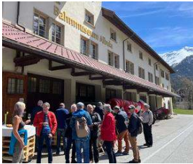
GV in Bergün